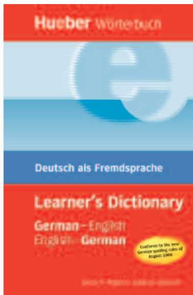
Hueber Wörterbuch Learner's Dictionary Deutsch-Englisch | Englisch-Deutsch