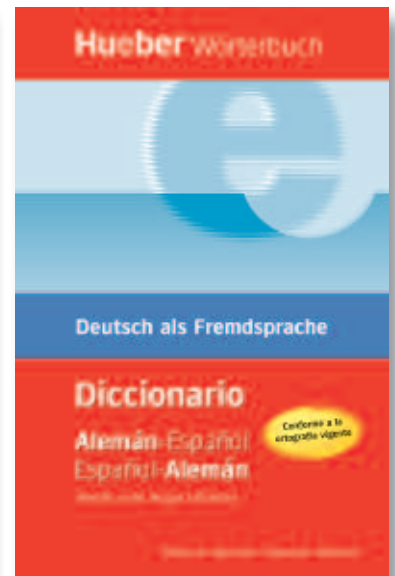
Hueber Wörterbuch Diccionario Deutsch-Spanisch | Spanisch-Deutsch