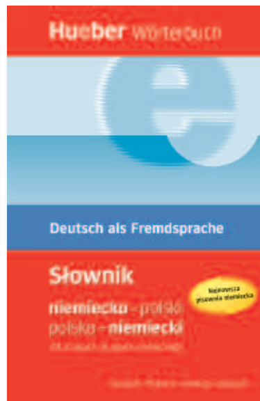
Hueber Wörterbuch Słownik Deutsch-Polnisch | Polnisch-Deutsch